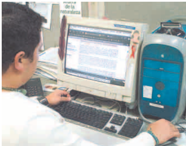
LOS POLÍTICOS VEN EN LOS BLOGS una herramienta moderna para atraer votantes, aunque por ahora el impacto mediático sea de menor envergadura.